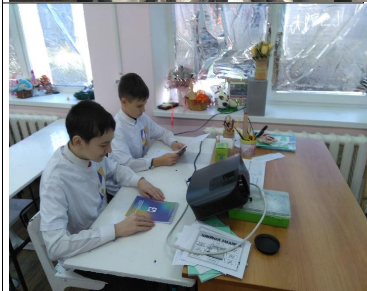
Фотография реализации профориентационной программы 3 - го дня