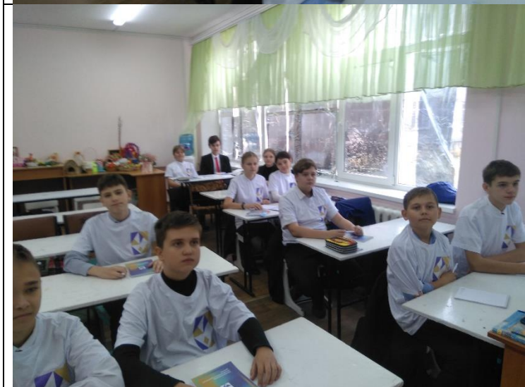
Фотография реализации профориентационной программы в 4 день