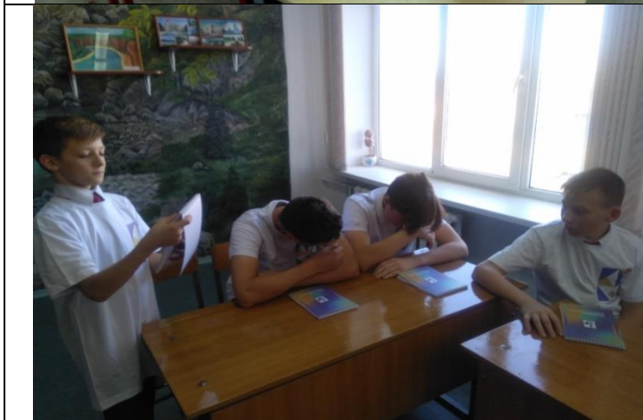
Фотография реализации профориентационной программы во 2-ой день