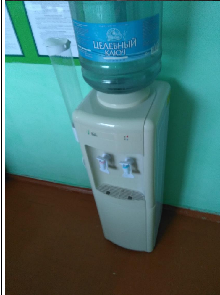
Фотография организации питания и питьевого режима

3. Было обеспечено изготовление и выдача каждому участнику и каждому лицу, привлекаемому к осуществлению деятельности, связанной с проведением 7-дневной каникулярной профориентационной школы с дневным пребыванием, комплектов расходных материалов и сувенирной продукции.