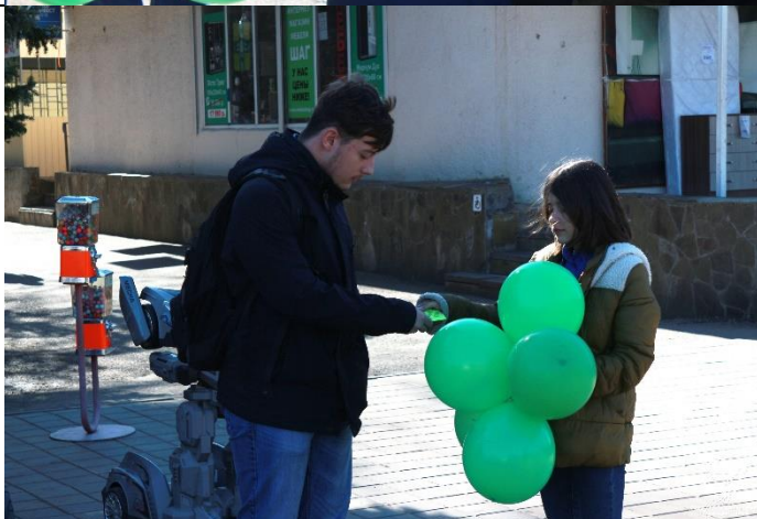
Фотография реализации профориентационной программы в 1-ый день