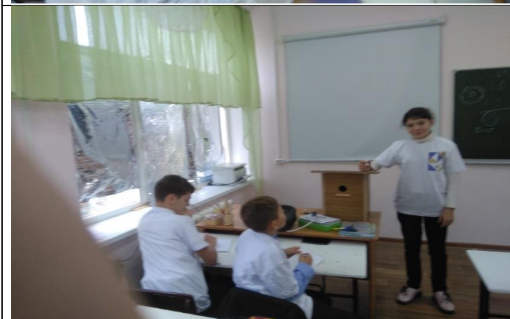
Фотография реализации профориентационной программы в 5 - ый день