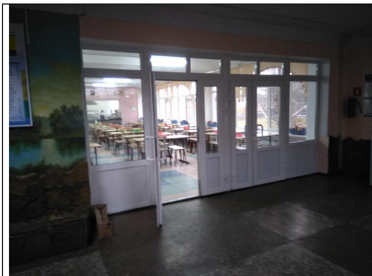
Фотография организации питания и питьевого режима

2. Участникам 7-дневной каникулярной профориентационной школы было обеспечено питание и питьевой режим: