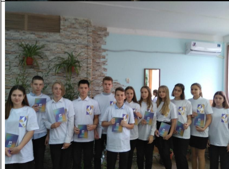
Фотография организации выдачи комплектов расходных материалов /сувенирной продукции

4. Была реализована профориентационная программа «Эко-мир Кубани».